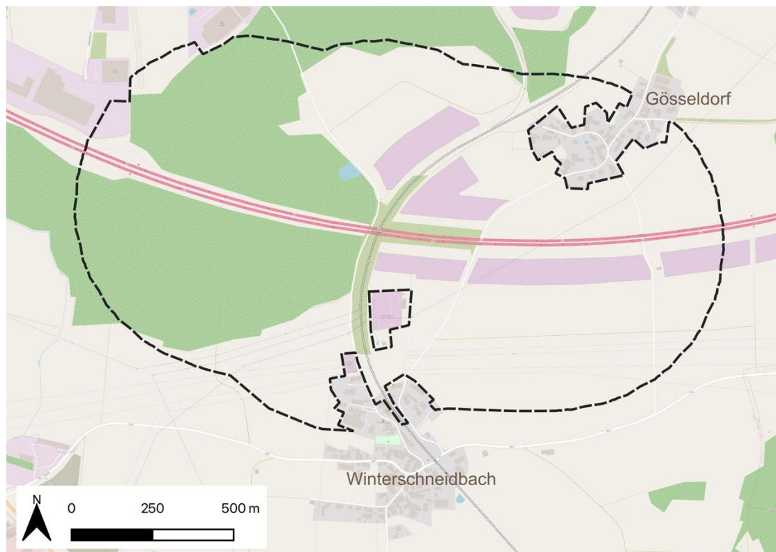
Abb. 1: Untersuchungsgebiet

Die westliche Seite des Untersuchungsgebietes wird in weiten Teilen von einem Nadelwaldbestand geprägt, in welchem ein kleines Stillgewässer auffindbar ist. Der Rest des Untersuchungsgebietes ist überwiegend landwirtschaftlicher Nutzung, mit Grünland und Ackerflächen sowie Photovoltaik-Freiflächenanlagen.